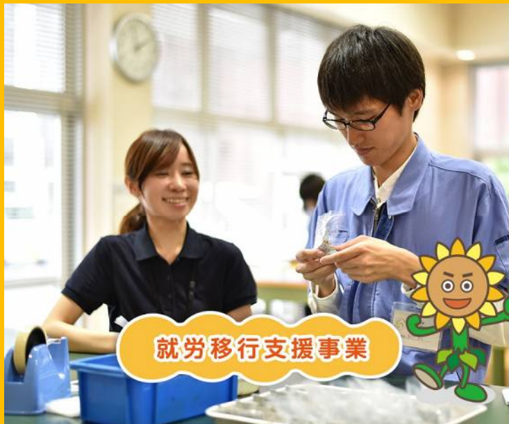
就労移行支援事業