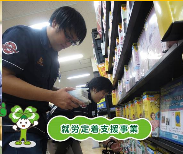
就労定着支援事業